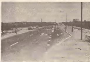
Inauguracion di carretera reconstrui Kibralma-Tanki Filip.